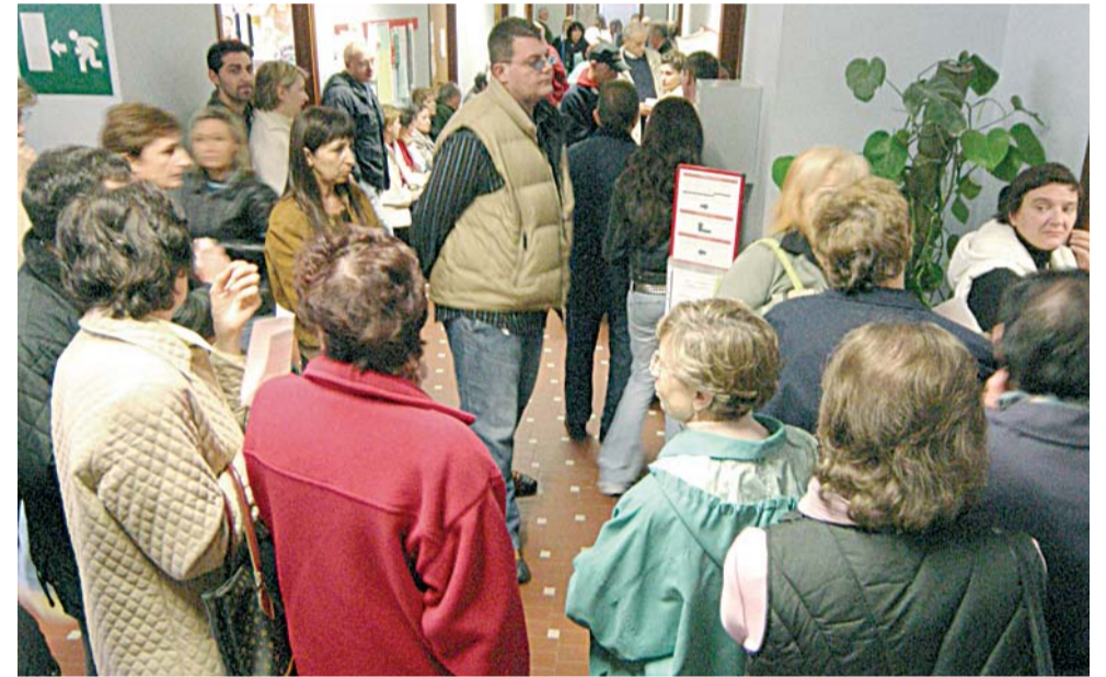
Un'immagine generica di persone in attesa di fare gli esami all'ospedale

Ci fermiamo qui, perché ogni caso è a sé, consigliando però ogni volta che si effettua una prenotazione di non scordare di fare, o far fare all'impiegato che ci troviamo di fronte, i conti del... «paziente».